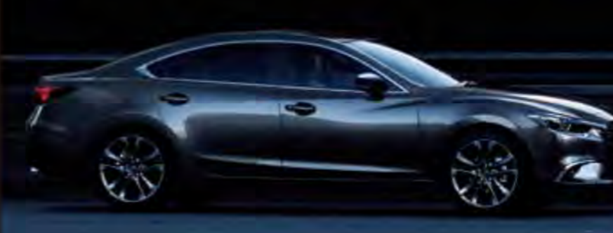
Body Color: マシニンググレープレミアムメタリック

Sedan XD L Package (クリーンディーゼルエンジン) SKYACTIV-D 2.2 2WD 6EC-AT (KK6610)