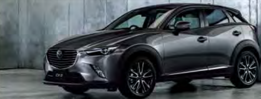
Body Color: マシニンググレープレミアムメタリック