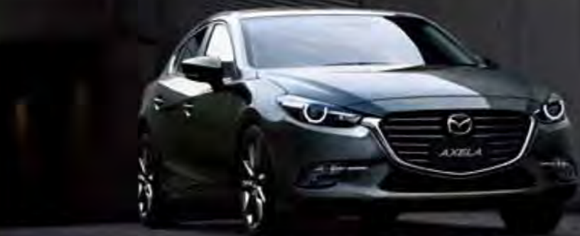
Body Color: マシニンググレープレミアムメタリック

Sport 22XD L Package (クリーンディーゼルエンジン) SKYACTIV-D 2.2 2WD 6EC-AT (SP2410)