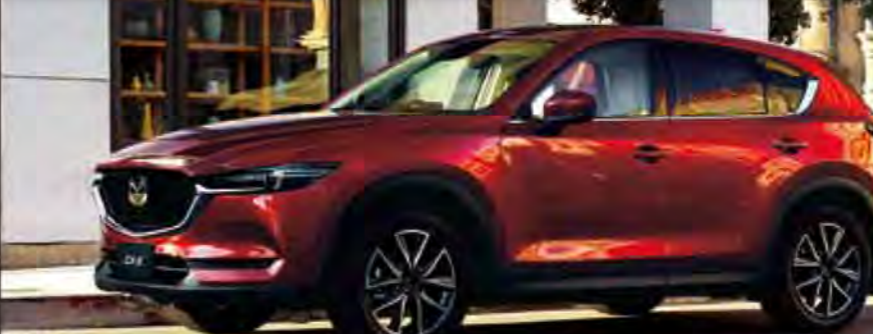
Body Color: ソルレッドクリスタルメタリック