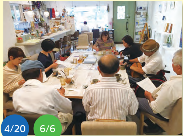
4/20 6/6 中央区県政報告会は憲法や旧優生保護法での強制不妊手術について勉強会を開きました。