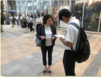
6/10 拉致被害者を救う署名活動に参加しました。若い人たちがたくさん署名してくれました。