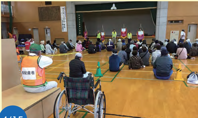
4/15 若葉校区の防災訓練に参加しました。2年前を思い出し、配慮が必要な方々の事もしっかりと考えられていました。

北区の「道楽窯」にて県政報告会。シングルマザーの実態や支援についてお話をしました。