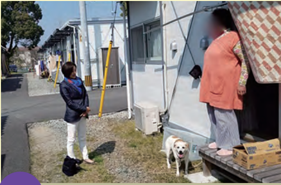
3/27 秋津の仮設団地を訪問して住民の方々から住まいの再建についてお話を伺いました。